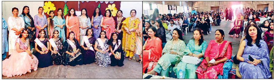
अंबाला। गेट टू गेदर में टाइटल पाने वाली छात्राएं व कार्यक्रम में मौजूद शिक्षक।

भाजपा संविधान बदलने की साजिश रच रही है। इस पर पलटवार करते हुए उन्होंने कहा कि भाजपा सबसे ज्यादा संविधान को मानती है क्योंकि भाजपा का घोषणा पत्र तब जारी हुआ जिस की संविधान निर्माता बाबा साहेब भीम राव अम्बेडकर का जन्म दिवस था और ये (कांग्रेस) बात संविधान की करते है जिन्होंने बाबा साहेब के बनाये संविधान को पैरो तले रौंदा उन्होंने फिर दोहराया कि इंदिरा गांधी ने एमरजेंसी लगाई और सारे मौलिक अधिकारों को कुचल दिया। उन्होंने कहा कि कई महीने लाखों लोगो को जेल में डाल कर रखा और चुनी हुई सरकारों को धर 356 लगाकर ऐसे तोड़ा जैसे बच्चा खिलोने तोड़ता है।