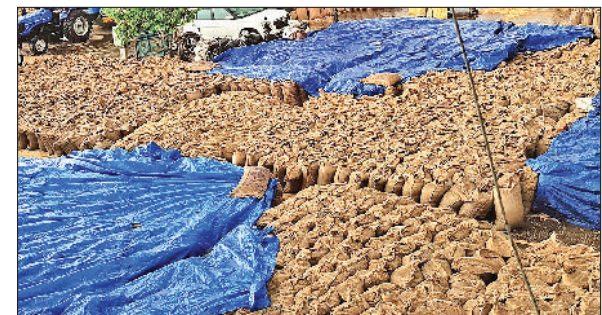
कुरुक्षेत्र। अनाज मंडी में पड़े गेहूँ से भरें कट्टे।